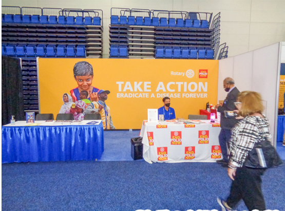
「友愛の広場」での各種ブース