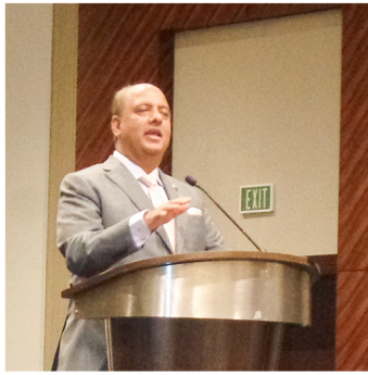
▲日本人親善朝食会における シェカール・メータRI会長の挨拶