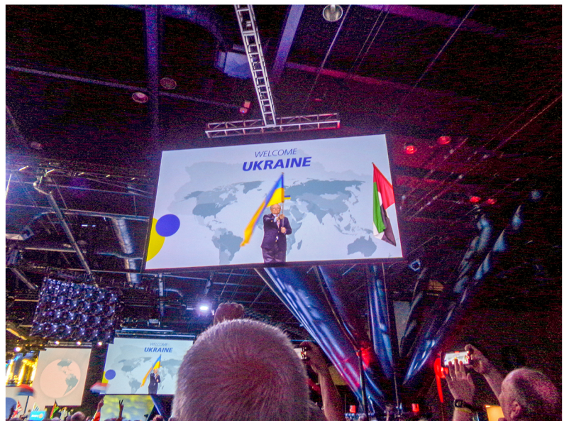
▲ウクライナ国旗入場