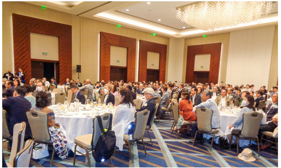
▲日本人親善朝食会の様子