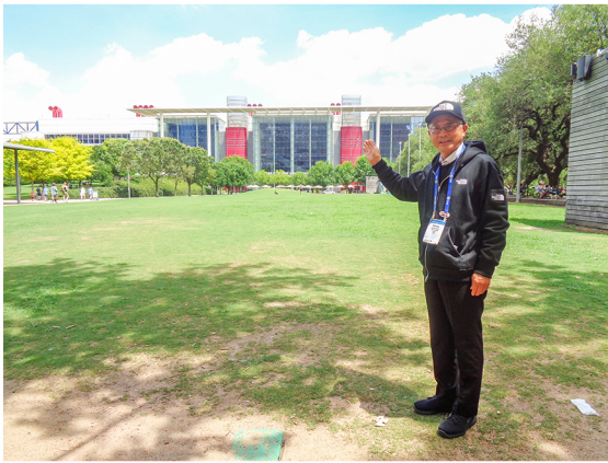
ジョージ・R・ブラウン・ コンベンションセンター （大会会場）の全景▶