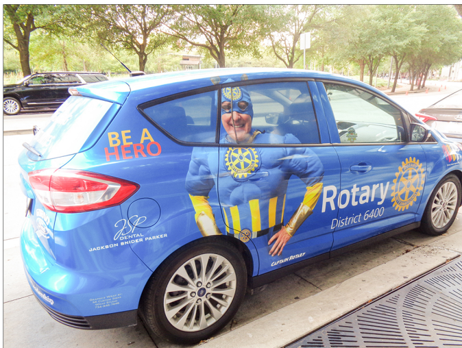
▲大会に参加した6400地区の パストガバナーの車 (トヨタのハイブリッド車、 スーパーマンの姿は本人)