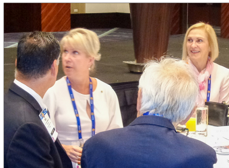
◀日本人親善朝食会に参加した ジェニファー・ジョーンズ RI会長エレクト 夫妻