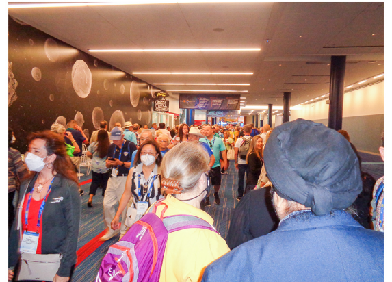
大会開会前の 廊下の混雑▶