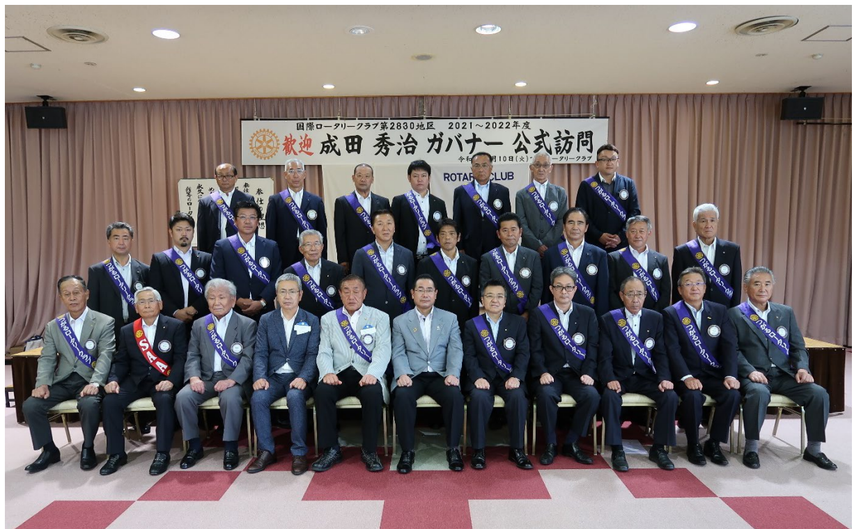
8月10日 つがるロータリークラブ