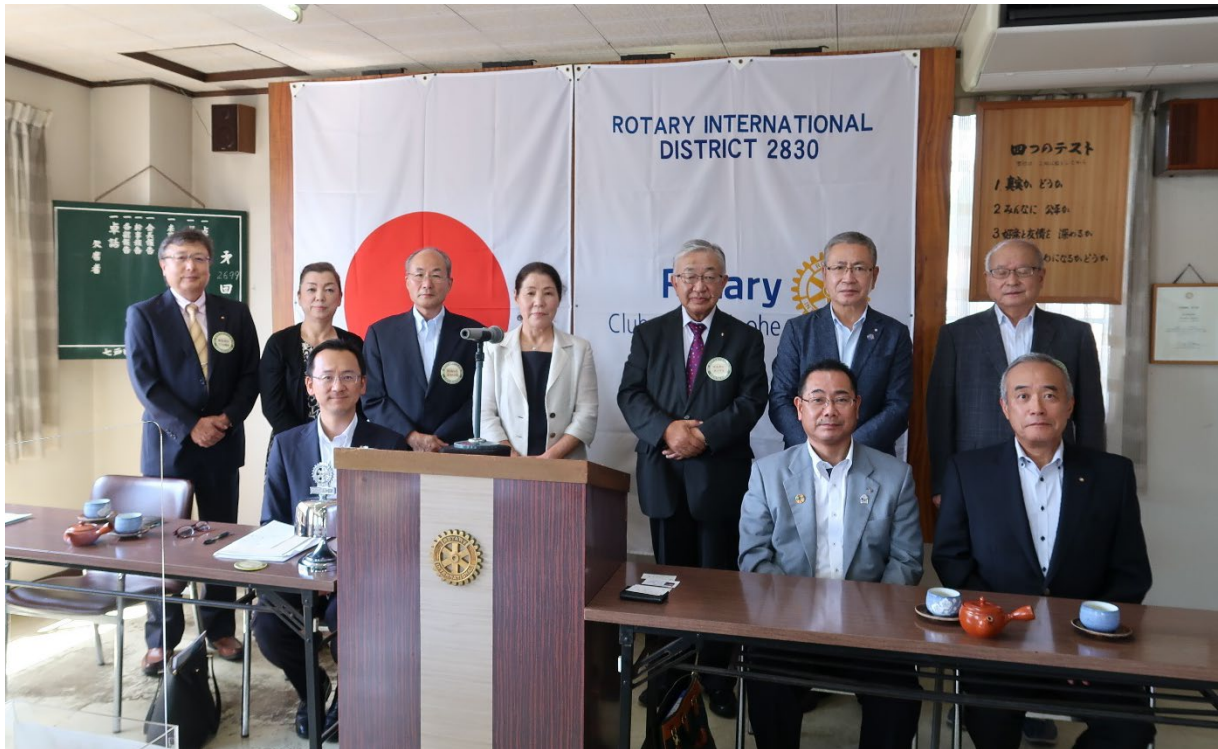
8月19日 七戸ロータリークラブ