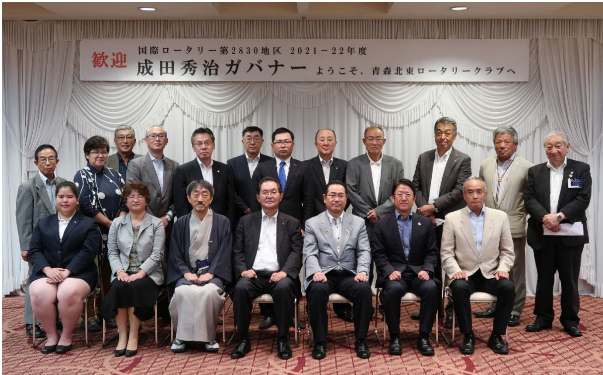
8月11日 青森北東ロータリークラブ