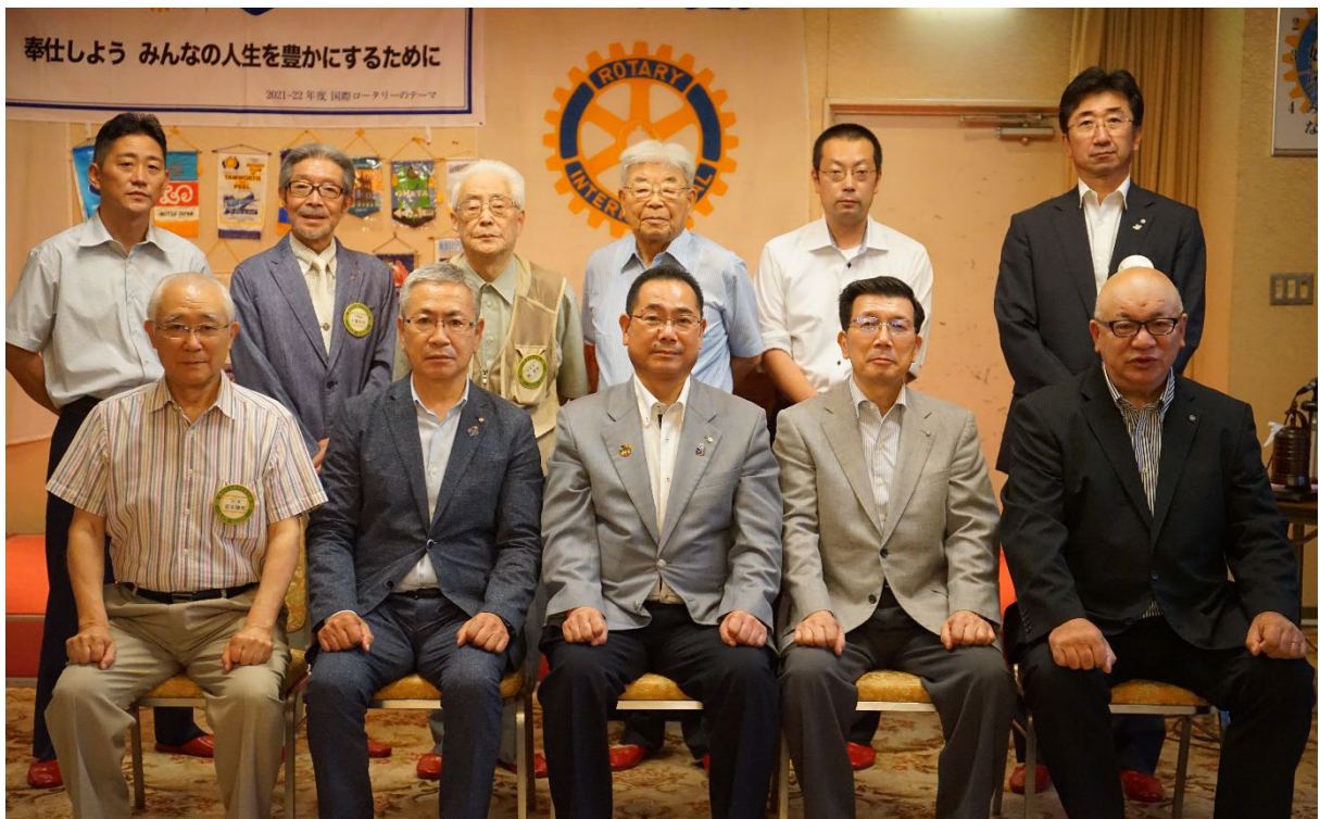
8月19日 三戸ロータリークラブ