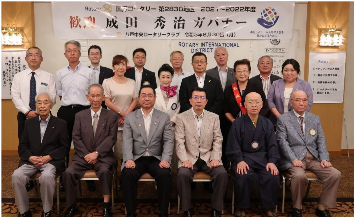
8月30日 八戸中央ロータリークラブ