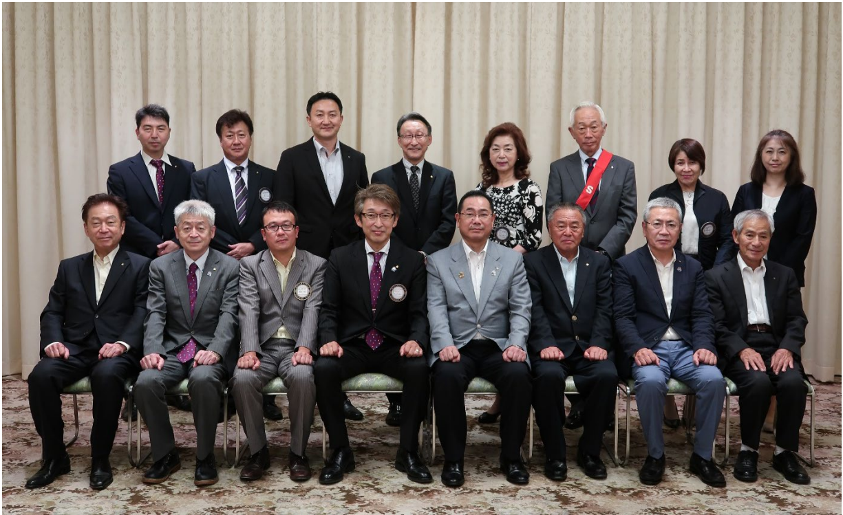
8月26日 弘前西ロータリークラブ