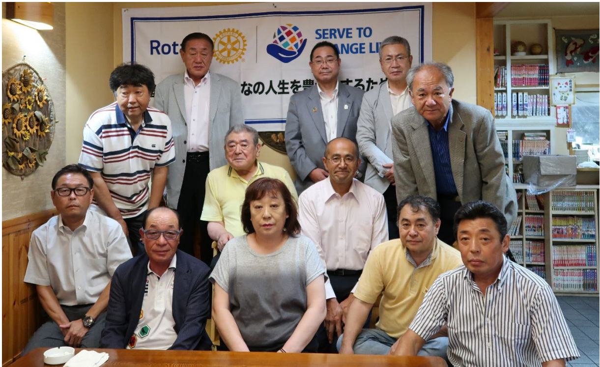
8月26日 鱒ヶ沢ロータリークラブ