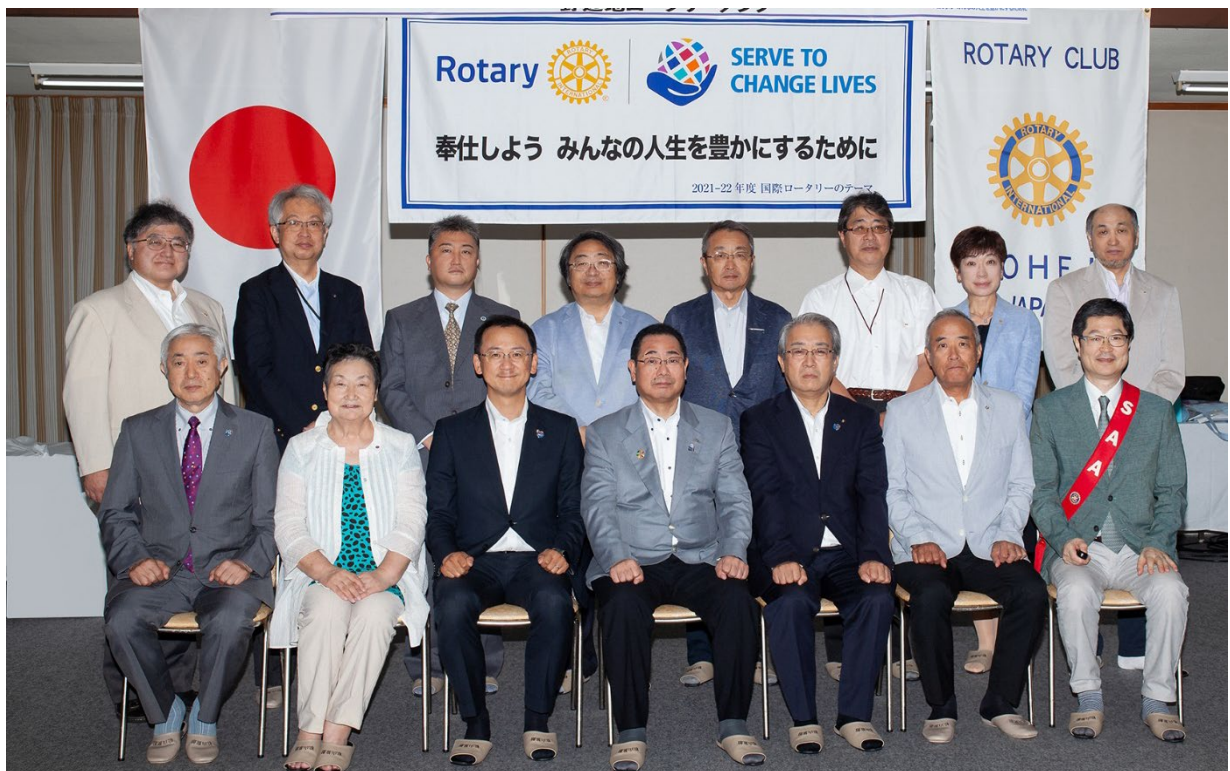
8月3日 野辺地ロータリークラブ