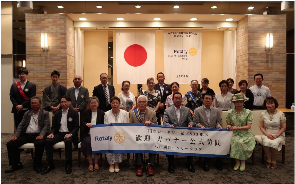
8月5日 八戸西ロータリークラブ