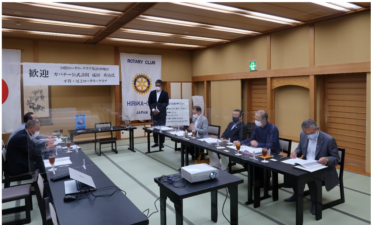
8月24日 平賀・尾上ロータリークラブ