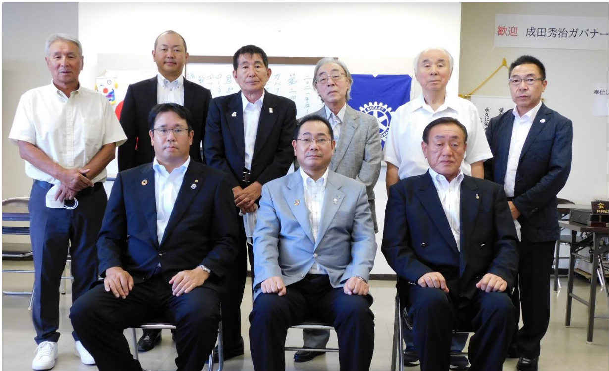
8月2日 鶴田ロータリークラブ