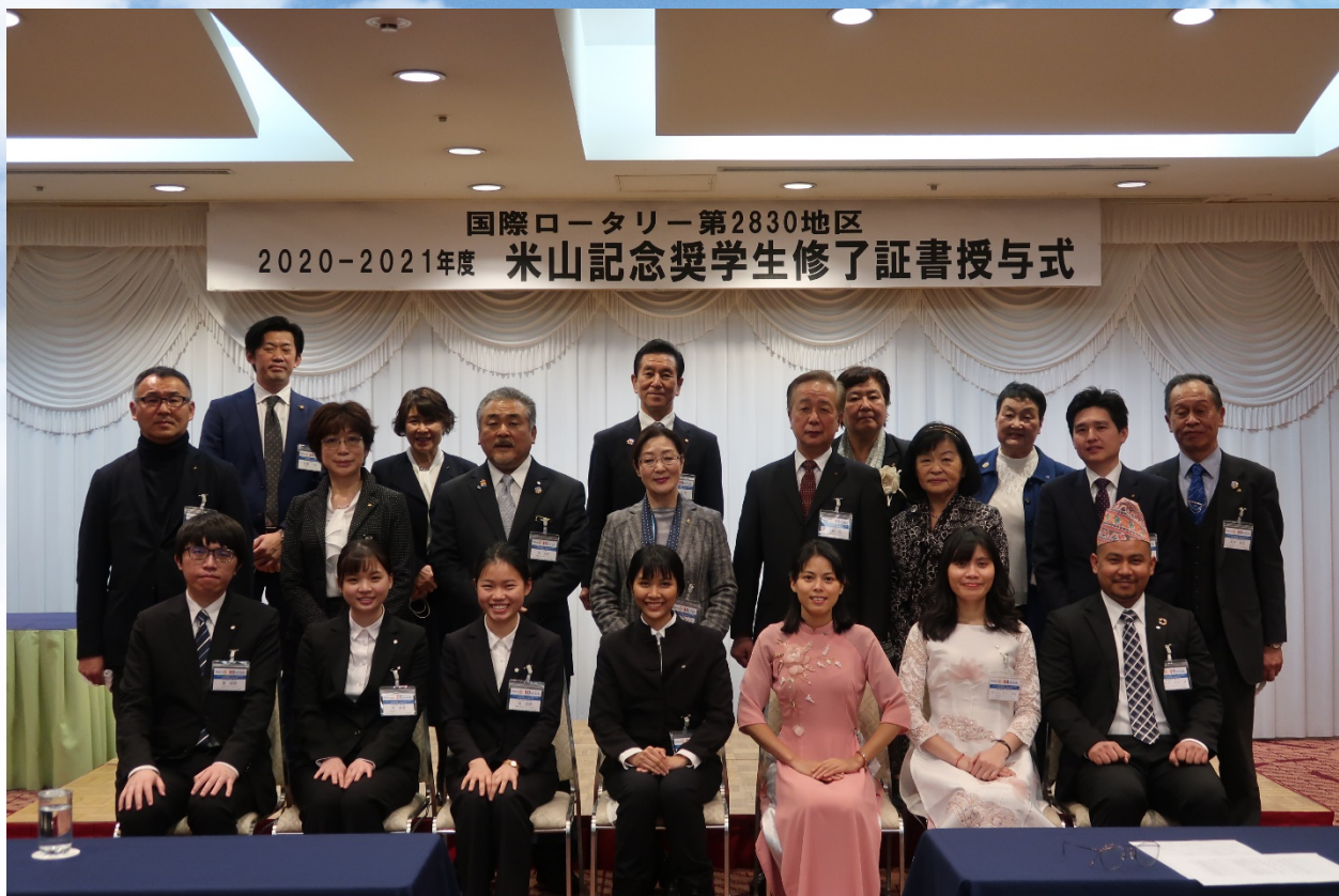
2020-2021 年度米山修了式 ホテル青森