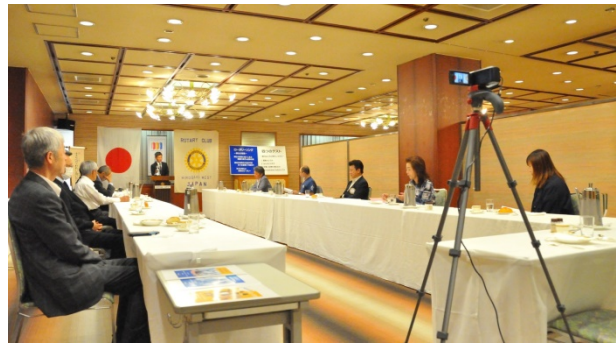
☞YouTube アップ用に録画練習中です (9/17)

まずは【オンライン例会の実現】です。このためにホームページを事務局で一から作ったり、例会の様様をカメラで撮ってYouTubeにアップしようと進めたりしています。ZOOMはまだまだ先になりそうです。