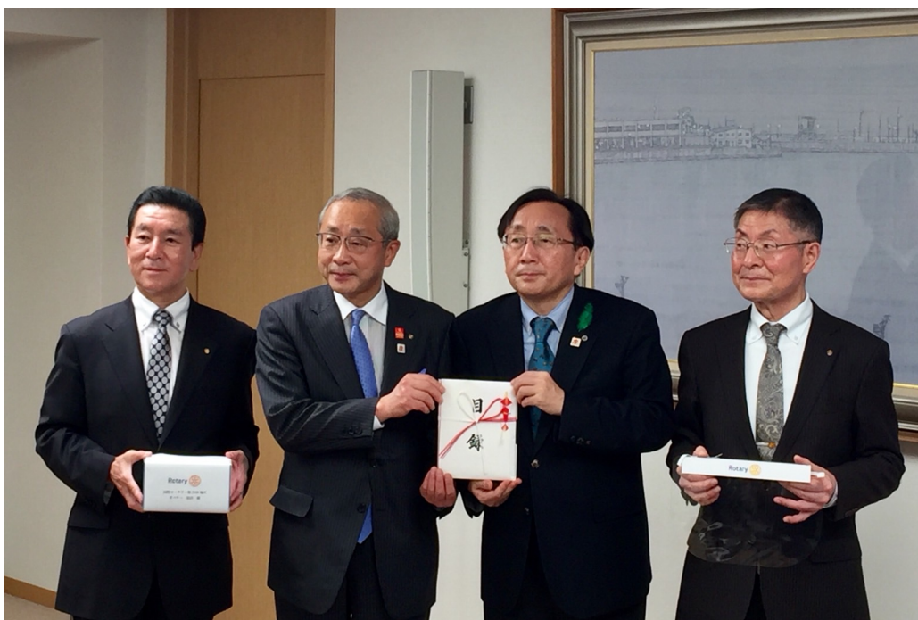
県庁でのフェイスシールド贈呈式 4月30日