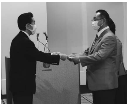
源新ガバナーから成田エレクトへ