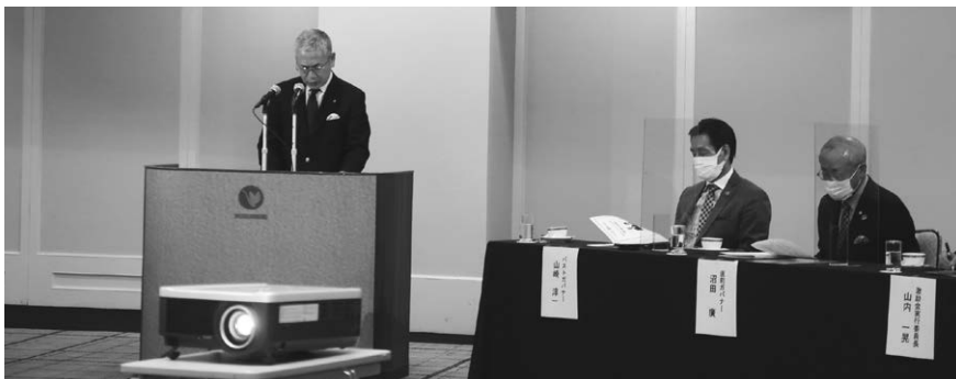
澁谷次年度地区幹事長