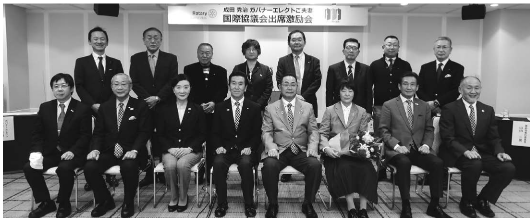
ホテル青森会場出席者