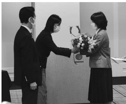
源新G令夫人から成田GE令夫人へ