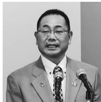
成田 秀治 ガバナーエレクト